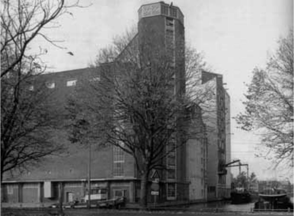
Afb. 2. Meelfabriek De Sleutels in 1989, met in het midden de graansilo uit 1904.

bruggen aan het hoofd van de fabriek stond, is door recent historisch onderzoek ontkracht.