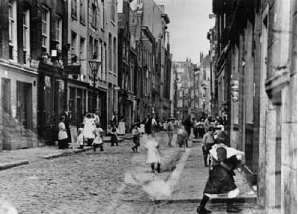
Afb. 1. De Peperstraat in het Zandstraatkwartier, gefotografeerd vanuit westelijke richting. Foto van Henri Berssenbrugge, circa 1910. Gemeentearchief Rotterdam.

journalist Brusse later, 16 voor de welgestelden en de meer verwende vreemdeling. 17 In dit bordeel konden zij het seksuele vermaak verwachten dat hun (elitaire) illusies het dichtst benaderde, mede vanwege de Franse vrouwen die er werkten en de moeite die de bordeelleiding deed om inrichting en verzorging zo veel mogelijk op de Franse leest te schoeien.