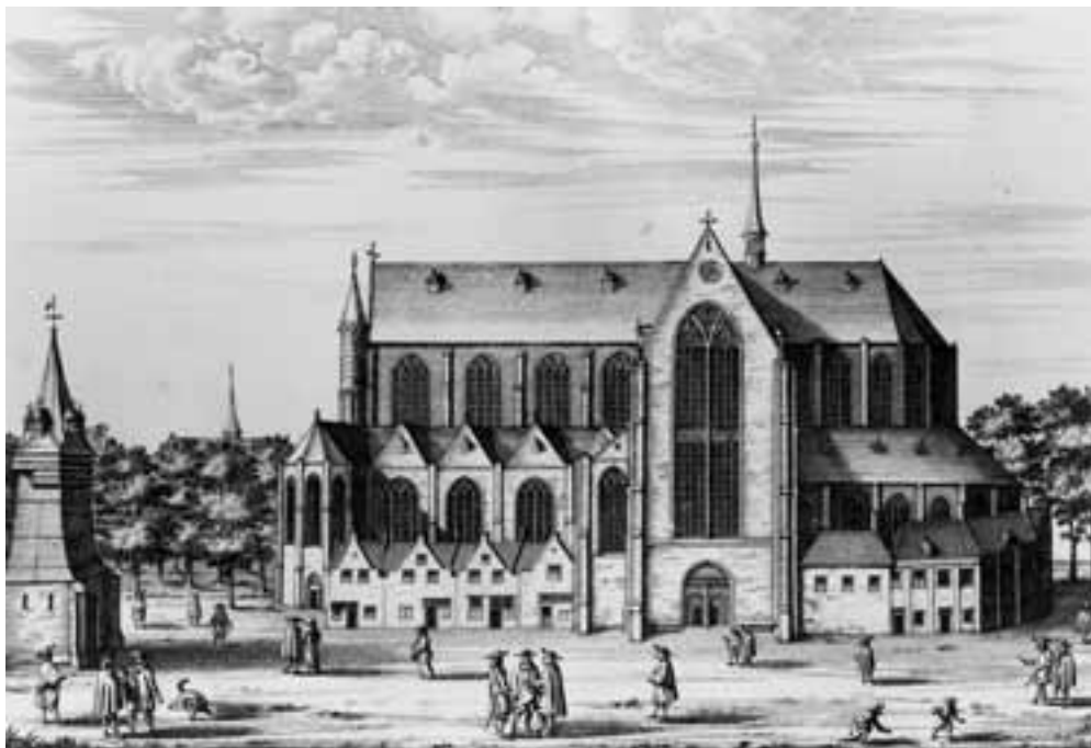
Afb. 3. De St-Pieterskerk te Leiden, vanaf de zuidzijde, 1670. Links zien we het klokhuis. Kopergravure door C. Hagen (23 x 28½ cm). Gemeentearchief Leiden, Prentverzameling 21881.

rekeningen veelal niet bewaard zijn gebleven. Het is dan ook zeer waarschijnlijk dat het aantal broederschappen dat zich met deze vorm van dodenzorg bezighield, in de praktijk veel hoger was.