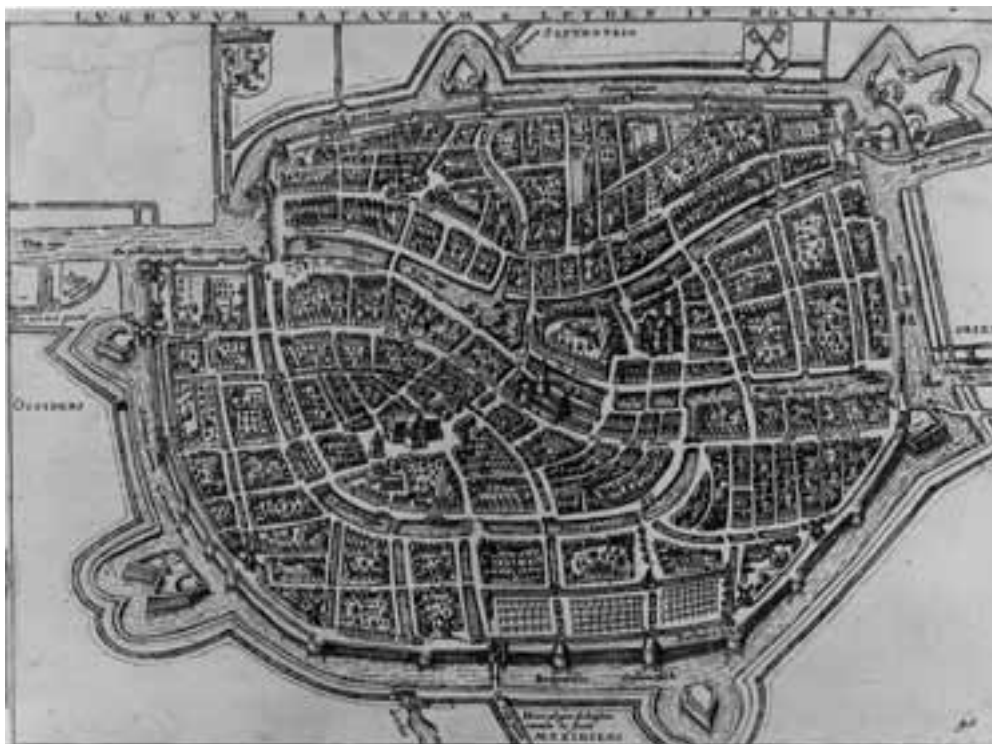
Afb. 2. Stadsgezicht van Leiden, 16e eeuw, met de drie parochiekerken: in het noordwesten bij 'Marendorp' de Onze Lieve Vrouwekerk; in het midden de St-Pancraskerk en iets ten westen daarvan de St-Pieterskerk. Kopergravure uit Guicciardini (23½ x 32½ cm).

veilig te stellen. In de late Middeleeuwen probeerde men hier systematisch in te voorzien. Een van de mogelijkheden hiertoe was de stichting van een kapelanie, waarbij een persoon een altaar begiftigde met renten, die de inkomsten vormden van de bedienende kapelaan. Deze zou jaarlijks, wekelijks of zelfs dagelijks een mis opdragen en bidden voor de zielen van de stichter van de kapelanie en zijn familie. 34 Het moge duidelijk zijn dat zo'n stichting alleen voor de elite weggelegd was. Voor minder welgestelden was het lidmaatschap van een broederschap een goedkoper alternatief. 35 De broederschap verzorgde namelijk de begrafenissen van de overledene. Vervolgens nam zij de zorg voor de herinnering van de overledene op zich.