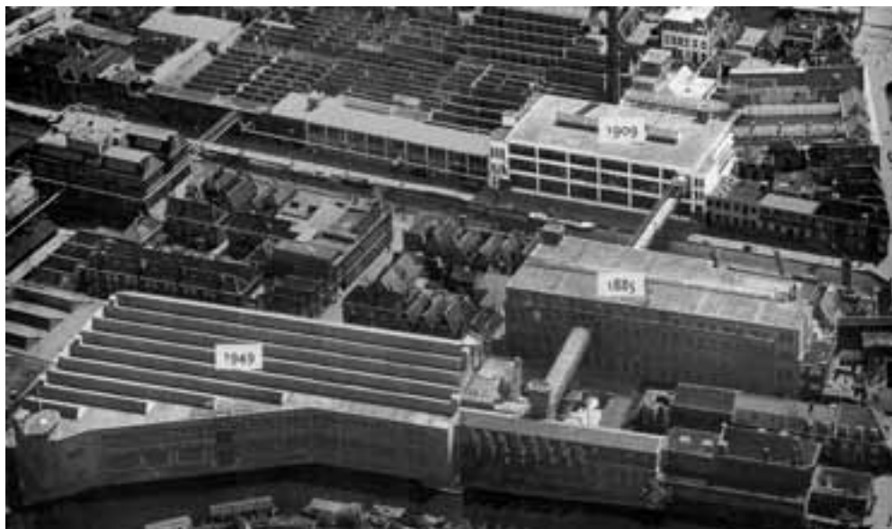
Afb. 1. Luchtfoto van het complex van Clos & Leembruggen omstreeks 1966.

Clos & Leembruggen begon in 1766 met de productie van dure gewezen stoffen als grein en polemiet. Bij het tweede eeuwfeest produceerde het bedrijf vooral sajetten oftewel garens. Een deel daarvan was bestemd voor de industrie terwijl ook breiwool onder de bekende merknaam Leithen op de markt kwam. Bijzonder is dat het bedrijf bijna 200 jaar werd geleid door een telg uit de familie Leembruggen, zeven generaties lang. Bijna, want de hardnekkige mythe dat nooit iemand anders dan een Leem-