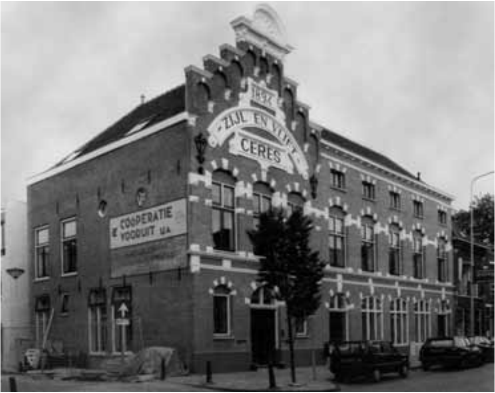
Afb. 4. Het gebouw van Ceres en Vooruit na de verbouwing in 1996.