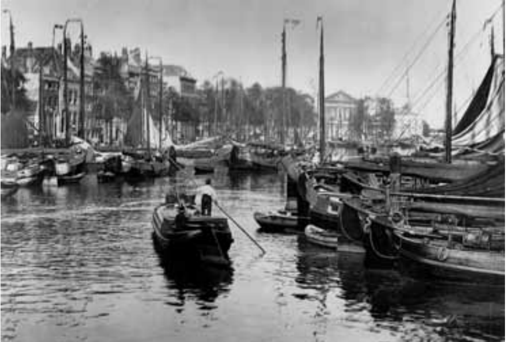
Afb. 3. Het Haringvliet vanuit westelijke richting, met op de kade de contouren van Palais Oriental (links van het midden van de foto). circa 1883.