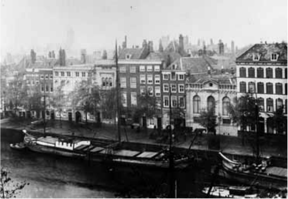
Afb. 2. Palais Oriental op het noordelijke Haringvliet, hoek Pauwensteeg (het eerste huis rechts).