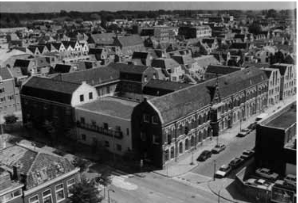
Afb. 3. De fabriek van Tieleman & Dros na de verbouwing tot bedrijfsverzamelgebouw en Buurthuis. Tegenwoordig staat het gebouw bekend als 'Mostertcomplex'.

Conservenfabriek Tieleman & Dros was gevestigd in de wijk Pancras-Oost, een gebied aan de oostzijde van de binnenstad waar al vroeg Leidse nijverheid was geconcentreerd. Door een onbekende architect is het complex in 1877 neergezet als een compositie van agrarisch aandoende pakhuizen van één verdieping onder een mansardedak. Tuinders uit de regio konden met hun schuiten de (inmiddels gedempte) Middelstegegracht opvaren om hun waren aan de fabriekspoort af te leveren. Toen de fabriek in 1955 failliet ging, kocht de gemeente Leiden het complex, om het vervolgens grotendeels te laten slopen. Een deel van de façade bleef intact, waarna het uiteindelijk in 1986 in gebruik werd genomen als bedrijfsverzamelgebouw en buurthuis. Aan de overzijde staat het gebouw van de oorspronkelijk daar gevestigde zeepziederij Dros & Tieleman, dat thans in gebruik is door een energie- en watermaatschappij.